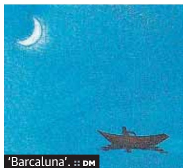
'Barcaluna'. :: DM

► El artista. Ha realizado más de 100 exposiciones y su obra figura en museos y colecciones.